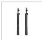
Стойка 200 см 2 шт.