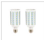
Лампа LED 30W, E27 2 шт.