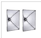
Софтбокс 50x70 см 2 шт.