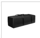
Сумка для переноски и хранения