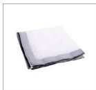
Рассеиватель 2 шт.