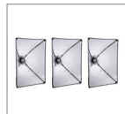
Софтбокс 50x70 см 3 шт.