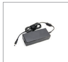
Адаптер 100-240V AC