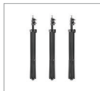
Стойка 200 см 3 шт.