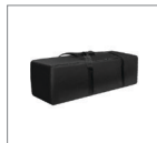
Сумка для переноски и хранения