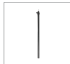
Перекладина 1 шт.