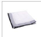
Рассеиватель 3 шт.