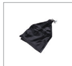
Мешочек для противовеса