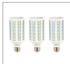
Лампа LED 30W, E27 3 шт.