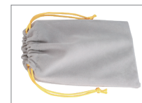
Мешок для переноски