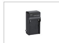
Зарядное устройство для аккумулятора