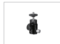
Шаровая штативная голова